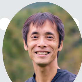
今話題のサステナブルな暮らしの実践者！