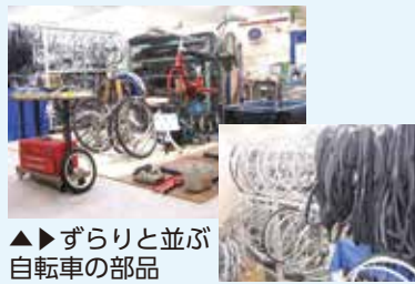
▲ずらりと並ぶ自転車の部品

提供いただいた自転車は、自転車工房にてスタッフの指導のもと、ご自身で必要な整備をしてお持ち帰りいただけます(組立体験1,500円)。また、工房にご自身の自転車を持ち込んでいただき、工房にある道具や部品を使っての修理体験(500円)も可能で、好評をいただいています。