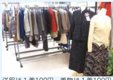
洋服は1着100円、着物1着100円～500円!

提供いただいた衣服や着物は、エコ・ポート長谷山にて有料でお譲りしており、どなたでも利用することができます。衣服は子ども服から紳士服、婦人服まで取り揃えています。