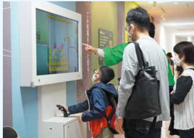
▲令和3年度環境まつり 施設見学イベント「ナイトツアーinクリーンパーク折居」

※今年の環境まつりは、新型コロナウイルス感染症拡大防止の観点から各イベントは日程や会場を分散して開催し、加えてWEBや広報紙を活用したイベントも行います。