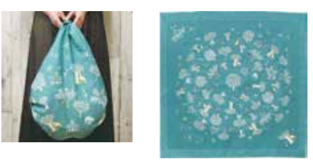
「100 MOTTAINAI ORGANIC」 ケニア人女性初のノーベル平和賞を受賞したワンガリー・マータイさんが 始めた植林による「グリーンベルト運動」。ふろしきのデザイン&モチーフは、 ケニアの大地をイメージしています。しずくバッグにすると丸い地球が姿を現します。

クロスワードを解い て、2重マスのA~Gの 7文字を順に並び替 えて、かくされた言葉 を見つけよう! 正解した人の中から、 抽選で京都の「むす美」 のふろしきまたは図書 カードをプレゼントし ます。