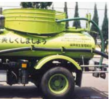
長谷山清掃工場 中央制御室

エコネット城南は新聞折込にて配布しておりますが、本号のみ全戸配布させていただきました。新聞未購読の方も、当組合ホームページでエコネット城南をご覧いただくことができます。