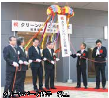
クリーンパーク折居 竣工