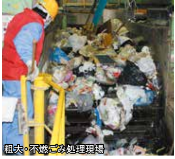
粗大・不燃ごみ処理現場