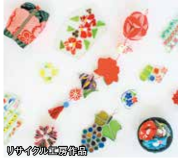
リサイクル工房作品