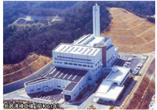
折居清掃工場(昭和61年)