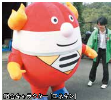
組合キャラクター「エネキン」

工房・教室に関するお問い合わせはこちら エコ・ポート長谷山 TEL:0774-56-5556