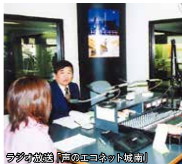
ラジオ放送「声のエコネット城南」

切に使い、ごみを減らすこと）・リユース（使えるものを繰り返し使うこと）・リサイクル（ごみを資源として再び利用すること）、いわゆる3Rを推進するとともに循環型社会の構築に向け、積極的に事業をすすめてまいりました。 今日に至るまで、管内住民の皆さま、関係各位のご理解とご協力に心から感謝を申し上げます。今後とも、社会情勢の変化等に適切に対応し、「安心安全な工場運営」、「住民感覚に沿った行政改革」、「循環型社会の構築に向けた事業の推進」を基本方針として、皆さまの生活環境の向上と地球環境保全に取り組みたいと思っております。より一層のお力添えを賜りますようお願い申し上げます。