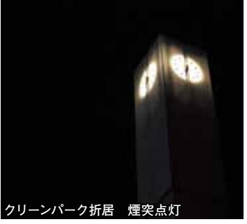
クリーンパーク折居 煙突点灯