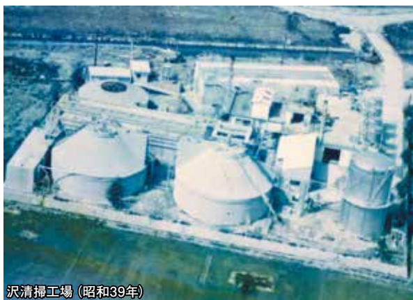
沢清掃工場(昭和39年)