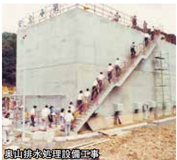
奥山排水処理設備工事