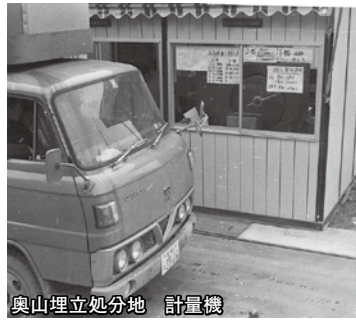
奥山埋立処分地 計量機