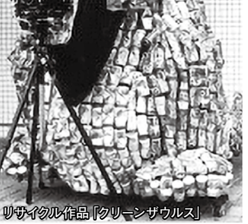
組合設立50周年記念作品