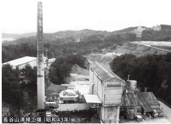
長谷山清掃工場(昭和43年)