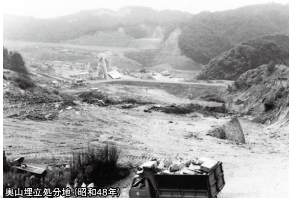
奥山埋立処分地(昭和48年)