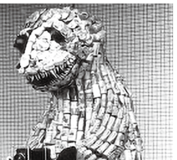
リサイクル作品「クリーンザウルス」