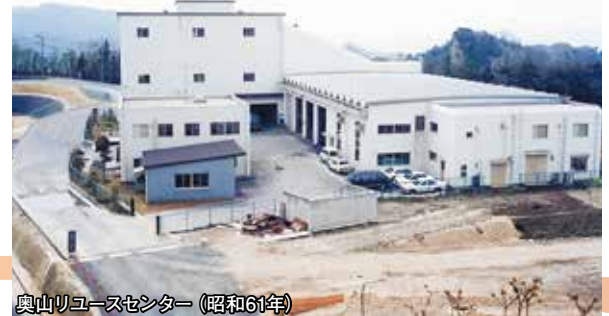
奥山リユースセンター(昭和61年)