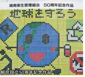
組合設立50周年記念作品