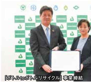
「ボトルtoボトルリサイクル」事業締結