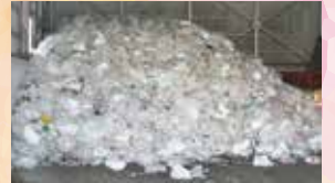
▲臨時ストックヤードに貯留するペットボトル 外出自粛の影響で搬入量が急増