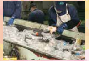
▲手選別作業の様子