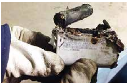
▲焼け焦げた充電電池

私たちが普段使っているノートパソコンや携帯電話、デジタルカメラなどの電気製品に使われている充電電池は、強い衝撃や金属接触により、発熱・発火することがあります。