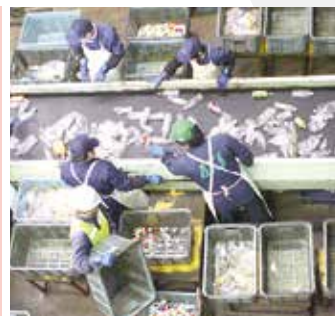
▲手選別作業の様子