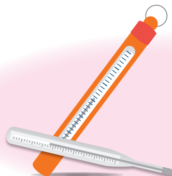
水銀を使った体温計・温度計